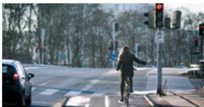
Højresving for rødt for cyklister side 4-5

I dette hæfte kan du finde mere viden om vejafmærkning eller vejregler for: