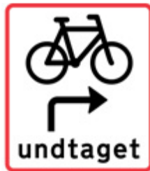
Højresving for rødt – U 7

Vejafmærkningsbekendtgørelsen indeholder nu den viste tavle. Kommuner skal stadig søge politiet om tilladelse til at opsætte tavlen. Tavlen opsættes kun i kryds, hvor det er forsvarligt i forhold til trafikikkerheden. De svingende cyklister har fortsat vigepligt for fodgængere, der krydser vejen for grønt lys og for tværkørende cyklister og lille knallert.