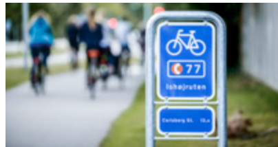
Supercykelstier side 8-9