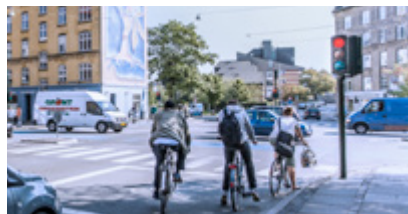
Cykelbokse side 6-7