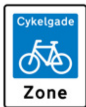
Cykelgade – E 47

Cykelgader afmærkes kun med de viste tavler. Der må ikke bruges cykelsymbol eller anden kørebaneafmærkning.