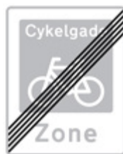
Cykelgade – E 48

Find mere information i bekendtgørelsen om anvendelse af vejafmærkning § 127 og § 128.