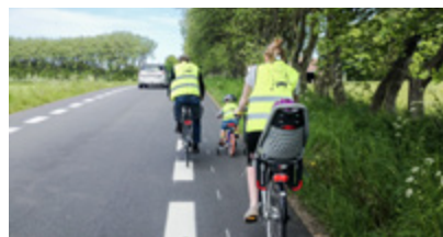
2 minus 1 veje side 14-15

Du kan finde mere information og film til formidling af nye cykelfremmende tiltag på Vejdirektoratets hjemmeside, vejdirektoratet.dk . Her kan du blandt andet også finde de nye vejafmærkningsbekendtgørelser og links til de beskrevne vejregler på cykelområdet. Du kan også finde mere på vejregler.dk .