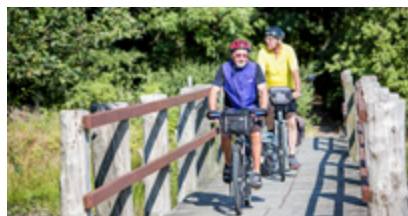
EuroVelo cykelruter side 12-13