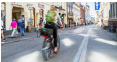
Cykelgader side 10-11